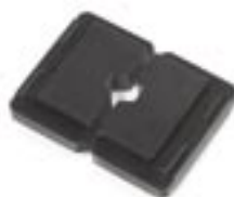
Crimpbacken 10 2 und 16 2 für Akku-Handcrimpzange EHC 10