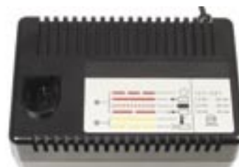
Akku-Handcrimpzange EHC 10 komplett mit Koffer, Ladegerät und Crimpeinsätzen