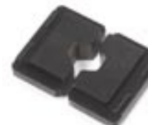
Crimpbacken 50 2 für Akku-Handcrimpzange EHC 10