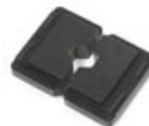
Crimpbacken 25 2 für Akku-Handcrimpzange EHC 10