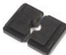
Crimpbacken 35 2 für Akku-Handcrimpzange EHC 10